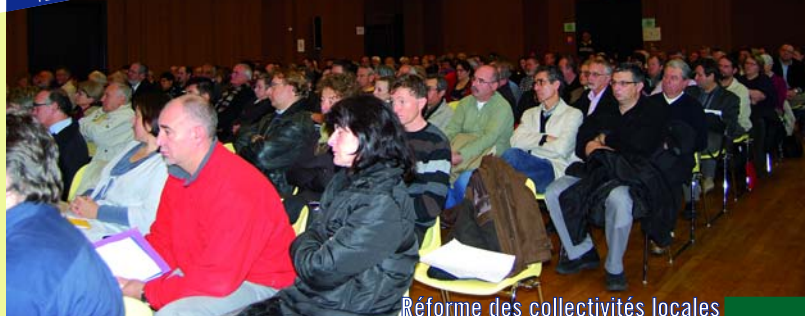
Réforme des collectivités locales